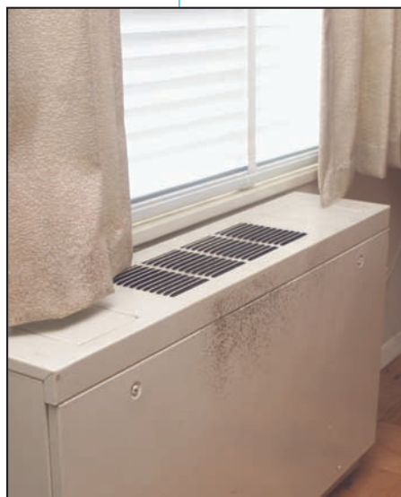
Moho creciendo sobre la superficie de un ventilador.

■ Cuando ocurran pérdidas o derrames de agua en el interior, ACTÚE RÁPIDAMENTE . Si se secan los materiales o las zonas mojadas o húmedas en las 24-48 horas que siguen una pérdida o derrame, no crecerá el moho en la mayoría de los casos.