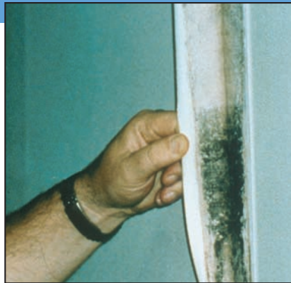
Moho creciendo detrás de un empapelado.

Sospecha de moho escondido Puede sospechar que existe moho escondido si un edificio huele a moho, pero que no puede ver su origen o si sabe que hubo daños causados por el agua y que los residentes se quejan de problemas de salud. El moho puede esconderse en lugares tales como la parte trasera de las planchas de yeso o drywall, empapelado, revestimientos de madera, la parte superior de baldosas de techo, la parte inferior de moquetas y tapices, etc. Las ubicaciones posibles del moho escondido incluyen zonas dentro de paredes alrededor de tuberías (con tuberías con pérdidas o condensación), la superficie de paredes detrás de muebles (en las que se forma condensación), en los conductos interiores, y en los materiales de techados encima de las baldosas de techos (debido a goteras en el techo o aislamiento insuficiente).