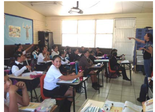
Presentación en una escuela primaria

Dos organizaciones sin fines de lucro, Wildcoast (San Diego) y ECOCE (una organización mexicana sin fines de lucro que recicla plásticos) se asociaron con tres escuelas de educación primaria en la comunidad Los Laureles de Tijuana (contigua a la frontera México-Estados Unidos) para educar a más de 780 estudiantes, 78 profesores, y personal administrativo de la escuela sobre la importancia del reciclaje, tanto en la escuela como en el hogar, para evitar que los plásticos se conviertan en basura que va a parar al estuario del Río Tijuana en San Diego. Se motivó a los niños a crear y/o unirse a clubes ambientales y se les entrenó en la reutilización de materiales como el plástico. En conjunto, la comunidad escolar recogió 11 supersacos de botellas de plástico, equivalentes 99 pies cuadrados de plástico. Contacto: Emily Pimentel , 415-972-3326