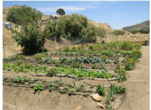
Jardín comunitario en la Colonia Luis Donado Colosio