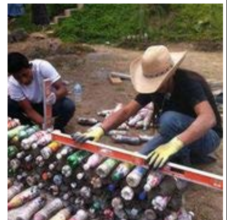
Botellas rellenas con basura se volverán bancas del parque

En agosto, la Fundación San Diego y EPA adjudicaron $45,000 (Dólares) a 4Walls International para construir parques binacionales utilizando como materiales de construcción desechos recobrados en el valle del Rio Tijuana y los cañones aledaños. De otra manera, dichos desechos reutilizados hubieran llegado al Rio Tijuana, afectando de manera negativa el frágil ecosistema de la Reserva Nacional Estuarina de Investigación del Rio Tijuana en San Diego . Las adjudicaciones de $25,000 (Dólares) de EPA y $20,000 (Dólares) De San Diego Foundation serán utilizadas por 4Walls y otras organizaciones mexicanas y americanas sin fines de lucro para trabajos en el Parque Los Laureles en Tijuana y la entrada al Border Field State Park en San Diego. El ministerio mexicano del medio ambiente (SEMARNAT) contribuyó también con recursos significativos para emplear aproximadamente a 100 personas, durante 12 semanas, mediante su "Programa de Empleo Temporal" para la limpieza del parque y el reemplazo de especies foráneas por plantas originarias de la región. Contacto: Doug