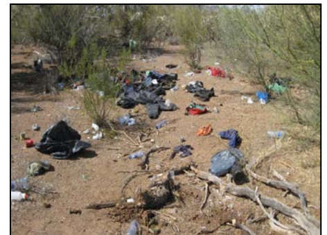
Acumulación de desechos

frontera con Arizona. La Nación Tohono O’odham (TON) removió de 109 sitios, incluyendo el distrito Chukut Kuk , que es uno de los doce distritos en la Nación Chukut Kuk más afectado con basuras dado el alto tráfico de peatones internacionales y contrabandistas cruzando la frontera internacional, ya que es el distrito más cercano a la frontera, 13 toneladas de basura y 101 bicicletas. El 10 de septiembre, Gary Olson de TON asistió a la reunión del equipo de trabajo de BLM y en ella compartió el problema con la eliminación de los vehículos abandonados, dada la mala calidad de las vías, más deterioradas aun por las lluvias monzónicas. Es casi imposible ahora mover equipo pesado en áreas que no tienen vías, para remover vehículos abandonados, y por dicha razón esta tarea ha sido aplazada. El señor Olson continúa trabajando con ADEQ para actualizar el sitio de internet de ADEQ sobre limpieza fronteriza. Dicho sitio en la red tiene ahora