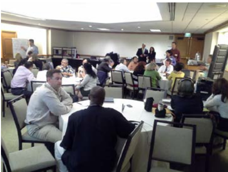
Participantes en el seminario web y taller

Taller sobre aplicación y cumplimiento de la ley ambiental: El 13 y 14 de junio pasados, el programa Frontera 2020 patrocinó un taller de aplicación y cumplimiento de la ley ambiental en San Diego, CA. Las metas del taller de dos días de duración fueron fortalecer la comunicación y el intercambio de información, el fortalecimiento de la capacidad de los representantes de la ley y la identificación de las prioridades para el programa fronterizo.