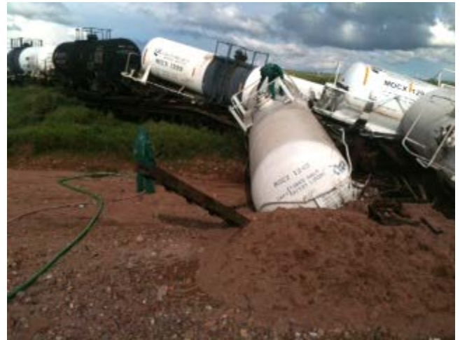
Vagones de tren derramaron 120,000 litros de ácido sulfúrico a lo largo de la frontera México-Estados Unidos

El 6 de agosto, un tren que se dirigía hacia el norte, cargado con 12 vagones de ácido sulfúrico se descarrilló entre las localidades de Cananea y Naco, Sonora, México, 32 millas al sur de la frontera México-Estados Unidos. Un puente de madera que colapsó fue la causa del descarrilamiento. Se dañaron cuatro vagones, dos de los cuales vaciaron la totalidad de su contenido, 90,000 litros de ácido sulfúrico. El ácido recorrió aproximadamente 800 metros. La totalidad del ácido sulfúrico derramado se estimó en 120,000 litros. No se registraron heridos ni muertos durante el incidente. El Equipo de trabajo de respuesta ante emergencias de Frontera 2020 coordinará una reunión en el futuro cercano para hablar sobre el incidente y sobre las lecciones aprendidas. Contacto: Lida Tan , 415-972-3018