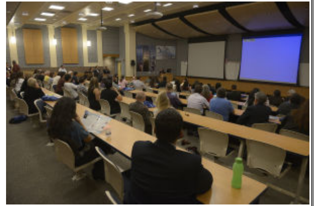
Imagen del Evento de artículo de Imperial Valley Press