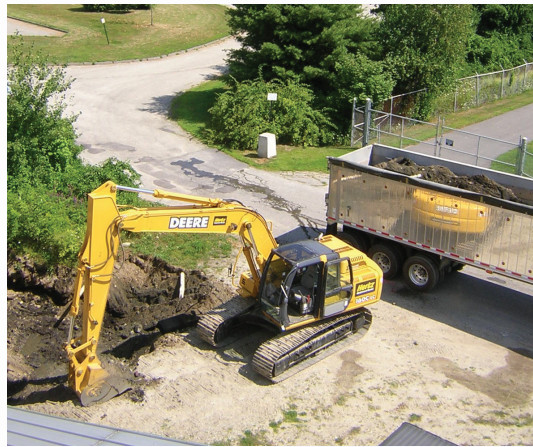
Excavación del suelo contaminado durante la fase de remediación

Las subvenciones de evaluación apoyan a las entidades que reúnen las condiciones a medida que inventarían, caracterizan, evalúan, y realizan la planificación y el involucramiento comunitario relevante a las antiguas instalaciones industriales. Una entidad que reúna las condiciones puede solicitar hasta $200,000 USD para evaluar un sitio contaminado por sustancias peligrosas o contaminantes, y hasta $200,000 USD para abordar un sitio contaminado por petróleo. Tres o más entidades que reúnan las condiciones pueden realizar una solicitud juntas en calidad de coalición para evaluar un mínimo de cinco sitios.