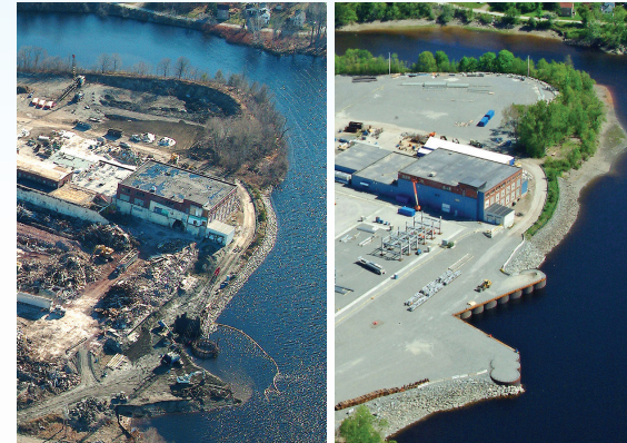
Demolición del sitio y urbanización del sitio.

Una entidad que reúna las condiciones puede solicitar hasta $200,000 USD para desarrollar un plan en todo el área y planificar estrategias de implementación que faciliten la evaluación de antiguas instalaciones industriales, la limpieza, la reutilización del sitio y el fomento de la revitalización de toda el área.