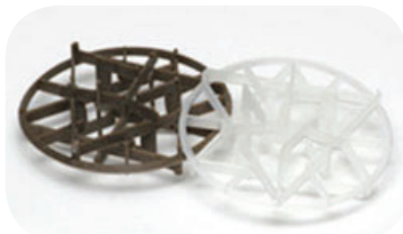
Ejemplo de material de relleno plástico.

La separación por aire es una manera eficaz de quitar los COV del agua contaminada y se suele usar como parte de los sistemas de bombeo y tratamiento del agua subterránea en sitios de todo el país. Se pueden llevar los separadores al sitio, lo cual elimina la necesidad de bombear agua contaminada para que se la trate en una planta externa.