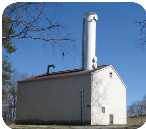
Separador por aire y edificio de tratamiento

Para instalar el separador por aire y el equipo de tratamiento se puede usar maquinaria pesada, sobre todo en sitios extensos y contaminados. Los vecinos de la zona pueden notar un aumento del tránsito de camiones cuando llevan equipo al sitio. Los tanques y las columnas grandes se pueden ver desde la calle y tal vez deban permanecer allí durante años. Sin embargo, se toman medidas para garantizar que los separadores funcionen de la manera más silenciosa posible.