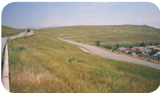
El pasto primaveral crece en el recubrimiento de un vertedero de desechos peligrosos.

Colocar un recubrimiento es el método tradicional de aislar los contaminantes y desechos en los vertederos. A veces se usa para cubrir grandes cantidades de tierra o desechos con poca contaminación. Los recubrimientos contruidos de asfalto u hormigón, o incluso una capa de tierra con pasto, pueden permitir la reutilización de algunos sitios. El recubrimiento ha sido la opción de muchos sitios afectados por la ley Superfund en todo el país.