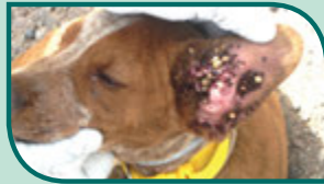
Perro con garrapatas cafés del perro en la oreja

A las garrapatas cafés del perro les gusta alimentarse de los perros. En dondequiera que estén o hayan estado perros, se puede encontrar garrapatas.