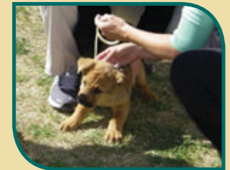
Perrito al que se le está poniendo un collar contra garrapatas