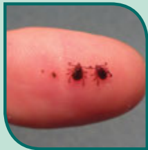
Garrapatas cafés del perro en cada etapa de su vida

Todo aquel que viva o pase tiempo en zonas en que haya garrapatas o perros tiene riesgo de contraer la FMMR. Estas garrapatas a menudo se alimentan de los perros, o sea que pasar tiempo con perros que tengan garrapatas puede ponerlo a usted en riesgo. Las garrapatas pueden ser muy pequeñas y sus picaduras generalmente no duelen.