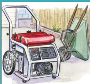
Máy Phát Điện Di Động

Khói hoặc khí độc thải ra từ máy phát điện di động có thể gây tử vong trong vòng vài phút nếu hít phải chúng!