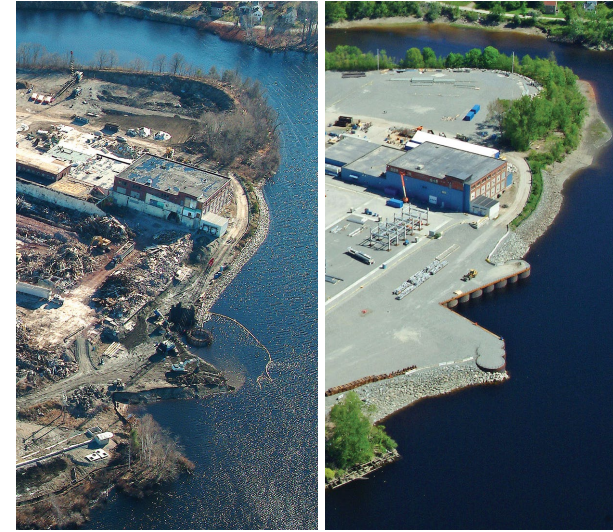
Demolición del sitio y sitio desarrollado

Las subvenciones para múltiples propósitos proveen fondos a las entidades elegibles para llevar a cabo una variedad de actividades elegibles, incluyendo inventario, caracterización y evaluación de brownfields; participación comunitaria relacionada con brownfields; actividades de limpieza en brownfields que son propiedad del solicitante; y desarrollo de planes de la reutilización del sitio o un plan general de revitalización. Una entidad elegible puede solicitar hasta $800,000 para abordar brownfields en un área objetivo específica.