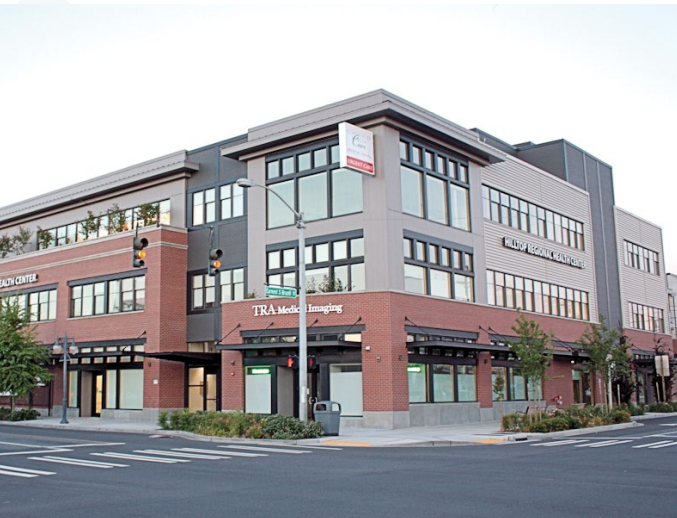
El Regional Health Center en Tacoma, Washington, fue en algún momento una tienda de comestibles abandonada, pero ahora ofrece servicios médicos y sociales a más de 17,000 personas al año.

Las subvenciones para evaluación apoyan a las entidades elegibles al momento de hacer inventarios, caracterizar, evaluar y planificar (por ejemplo, planificación para toda el área, planificación de reparación y planificación de reutilización) e involucrar a la comunidad en actividades relacionadas con los brownfields. Una entidad elegible puede solicitar hasta $300,000 para evaluar brownfields por sustancias peligrosas u otros contaminantes o petróleo. Tres o más entidades elegibles pueden postularse juntas como una coalición para evaluar un mínimo de cinco sitios hasta por $600,000.