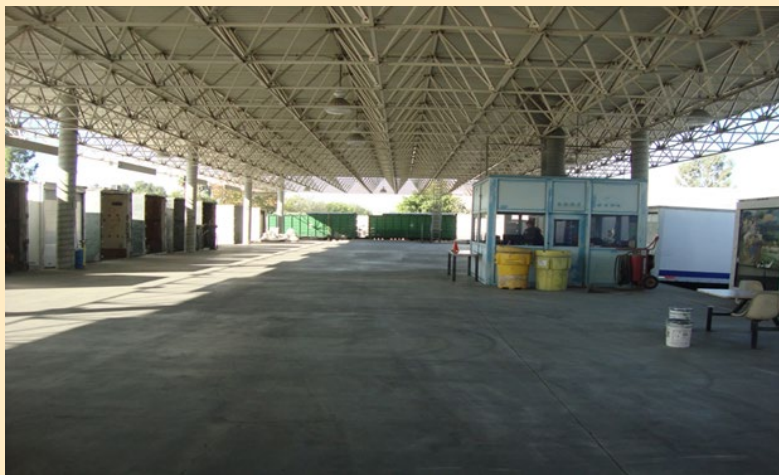
Area de inspección de camiones y vehículos de Aduanas y Protección Fronteriza de EE. UU. (USCBP, sus siglas en inglés) en el cruce de Otay Mesa.

La misión de DTSC es proteger a las personas y el medio ambiente de California de los efectos nocivos de las sustancias tóxicas restaurando los recursos contaminados, haciendo cumplir las leyes de residuos peligrosos, reduciendo la generación de residuos peligrosos y fomentando la fabricación de productos químicamente más seguros. DTSC, en asociación con la División de Manejo de Peligros del Condado de San Diego (County of San Diego Hazardous Management Division en inglés) realiza inspecciones de camiones en los cruces de frontera del este de Calexico y Otay Mesa.