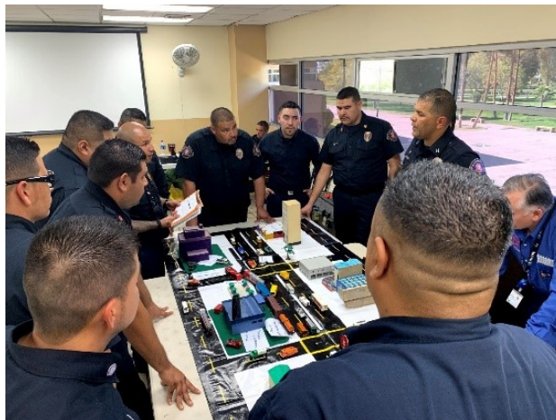
Capacitación en Mexicali, marzo del 2020.

La 5ta. Fase de Capacitación y Consultoría (5th Phase Training and Consulting su nombre en inglés) fue subcontratada por la EPA para llevar a Mexicali, Baja California, dos sesiones de capacitación en Comando de Incidentes y Materiales Peligrosos para mejorar la capacidad de respuesta de los socorristas. Cada sesión fue una capacitación en el Sistema de Comando de Incidentes ( ICS , sus siglas en inglés), Capacitaciones en Conocimiento de los Socorristas ( FRA , sus siglas en inglés), y curso de 24 horas de duración sobre el funcionamiento de los Socorristas ( FRO , sus siglas en inglés).