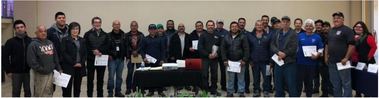
Taller de buenas prácticas para desmantelado de vehículos chatarra marzo del 2020.

La Secretaría de Desarrollo Urbano y Ecología del municipio de Nogales, Sonora con apoyo de dos subvenciones de Frontera 2020 está reduciendo la contaminación del suelo derivada de varias fuentes, entre ellas los tiraderos clandestinos de basuras y de vehículos chatarra.