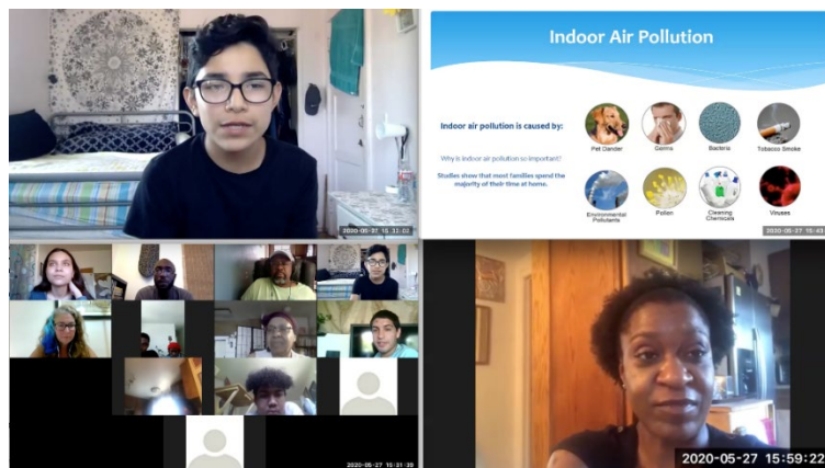
El Equipo Verde de la escuela secundaria presenta su seminario web a la comunidad de Chollas Creek.